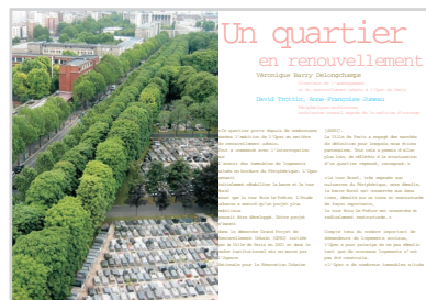
un quartier en renouvellement urbain